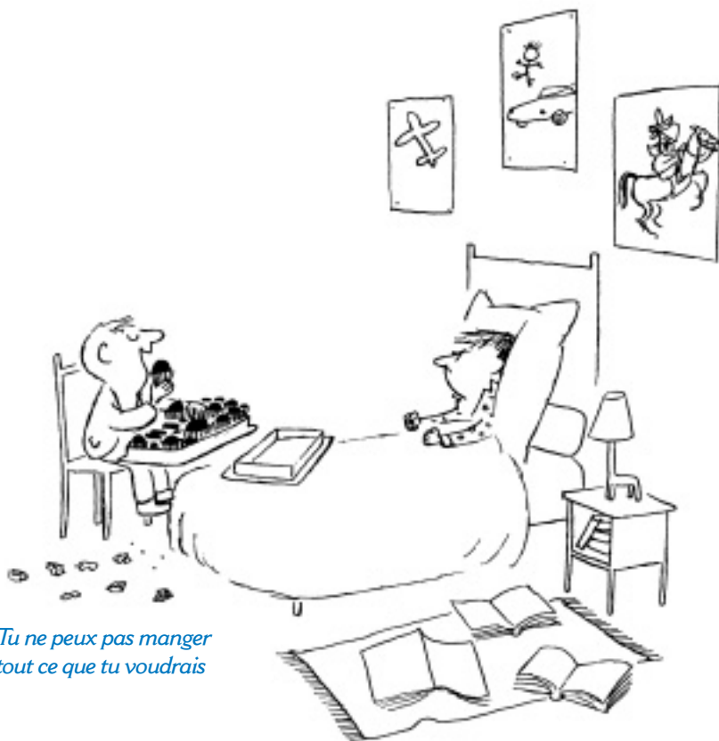
Tu ne peux pas manger tout ce que tu voudrais

où la faim se fait sentir, cela devient très éprouvant. À la maison, il est plus difficile d'être courageux, surtout si on l'a été déjà pendant la journée à l'école. Les rivalités entre frères et sœurs fragilisent et modifient le comportement des uns et des autres.